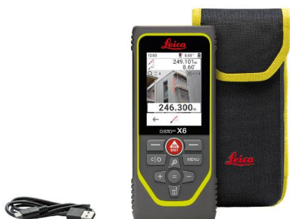
Leica DISTO™ X6 Réf. 950909

Leica DISTO™ X6, étui, câble USB-C vers USB-A, dragonne, manuel abrégé, carte de garantie, instructions de sécurité, certificat de calibrage Silver