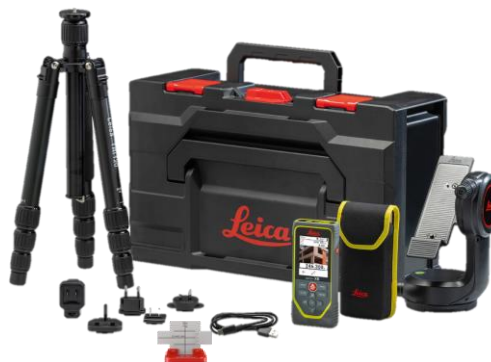
Leica DISTO™ X6 Pack P2P Réf. 950878

Leica DISTO™ X6, étui, câble USB-C vers USB-A, dragonne, manuel abrégé, carte de garantie, instructions de sécurité, certificat de calibrage Silver